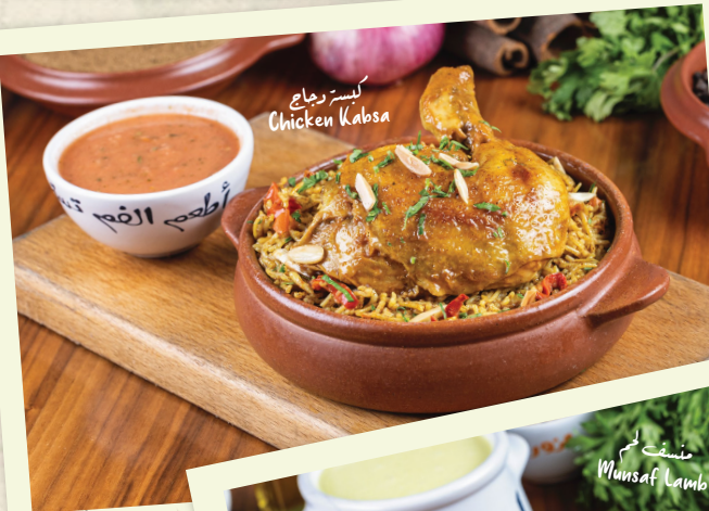
كيسر دجاج Chicken Kabsa