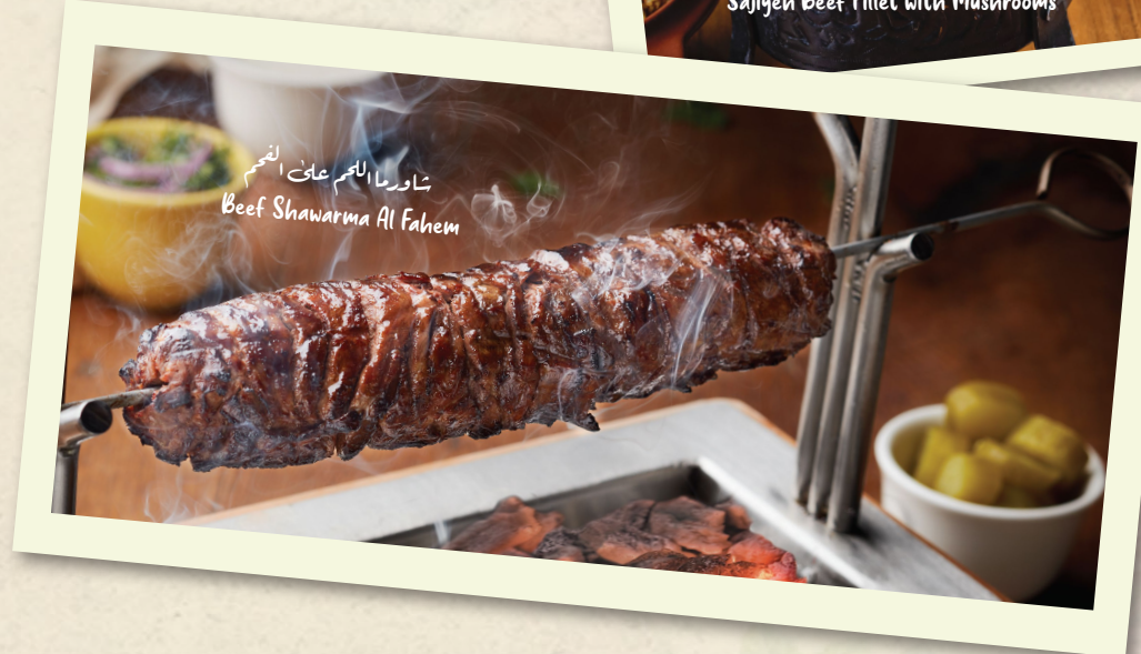
شاورما اللحم على الفحم Beef Shawarma Al Fahem