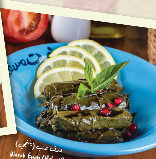
ورق عنب (يلنجي) Warak Enab (Yalanji)