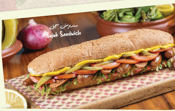
سندويش سوجك Sujuk Sandwich