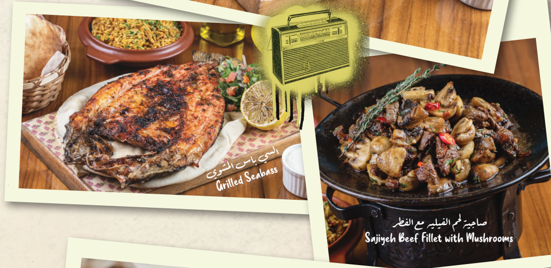
السي باس المشوي Grilled Seabass