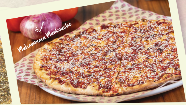
محمرة Muhammara Mankouche

Mixture of mozzarella and akkawi cheese. Add ons: Halloumi Cheese (QAR 3)