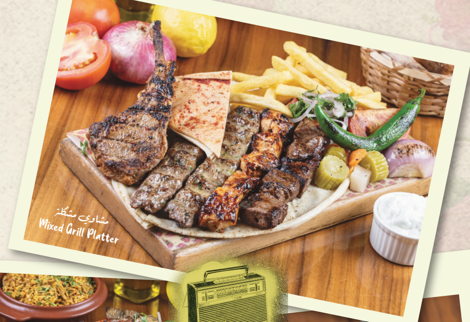
مشاوي مشكلة Mixed Grill Platter

An appetizing chicken shawarma stick served at your table over charcoal with saj bread, garlic, tomatoes and pickles.