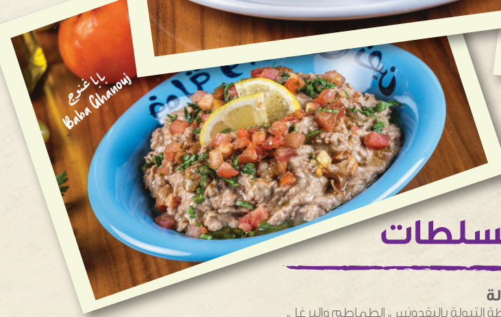
بابا غنوج Baba Ghanouj