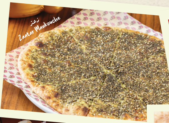
زعتر Zaatar Mankouche

A true classic; Middle Eastern thyme, sesame seeds, tangy sumac and olive oil. Add ons: Labneh - Veggies - Cheese (QAR 3)