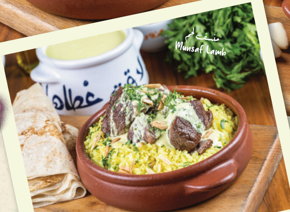
منسف لحم Munsaf Lamb