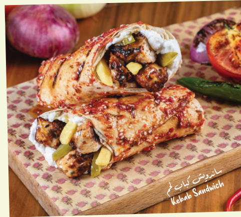
سندويش كباب لحم Kebab Sandwich