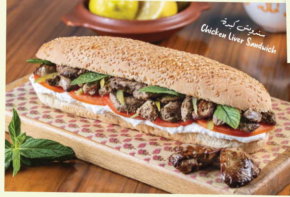
سندويش كبد Chicken Liver Sandwich