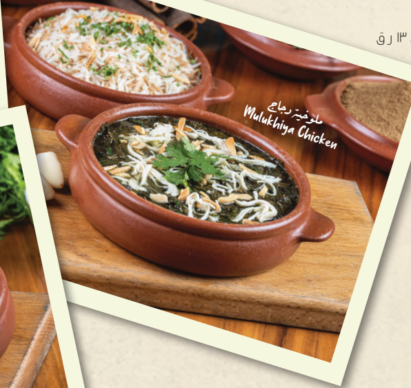
ملوخية دجاج Mulukhiya Chicken

15 Falafel Sandwich Fried falafel served on Arabic bread with lettuce, cucumber pickles, mint, tomato, turnip pickles, and tarator sauce.