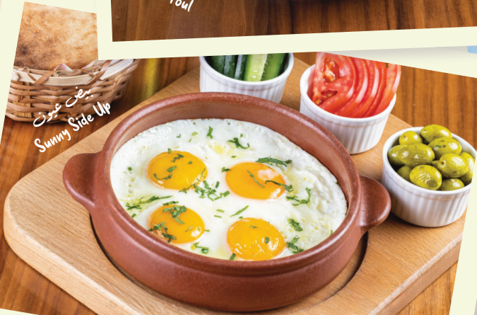
بيض عيون Sunny Side Up