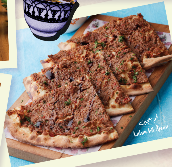
لحم بعجين Lahm bil Ajeen