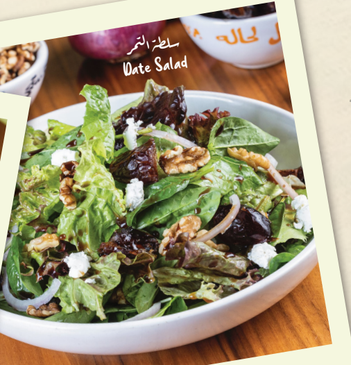
سلطة التمر Date Salad