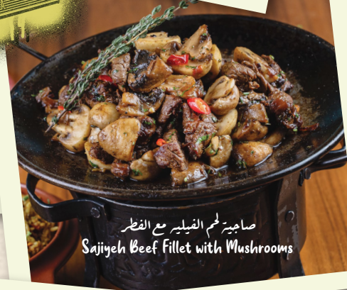
صاجية لحم الفيليه مع الفطر Sajiyeh Beef Fillet with Mushrooms