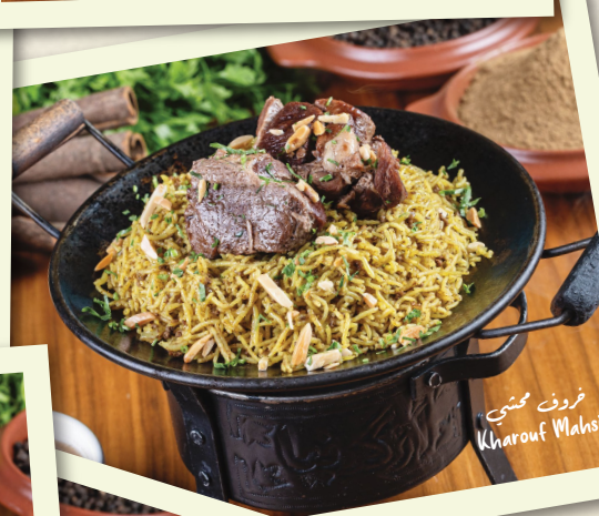
خروف محشي Kharouf Mahsi