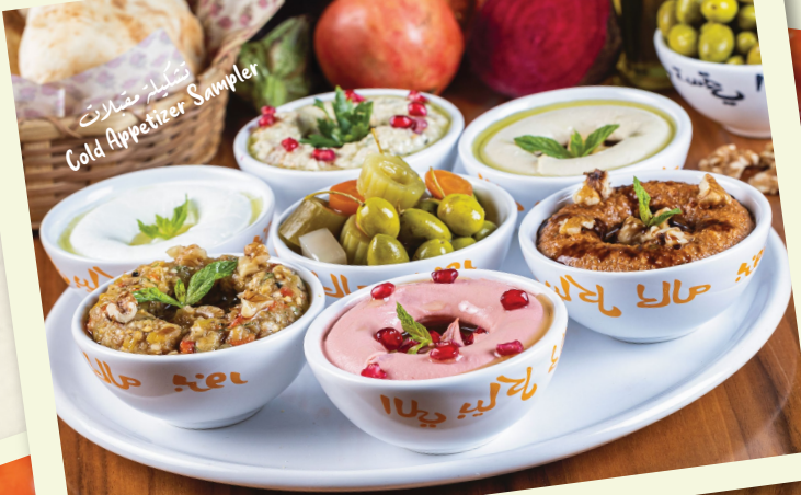
تشكيلة مقبلات Cold Appetizer Sampler